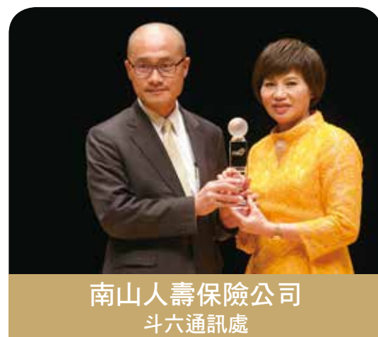
南山人壽保險公司 斗六通訊處