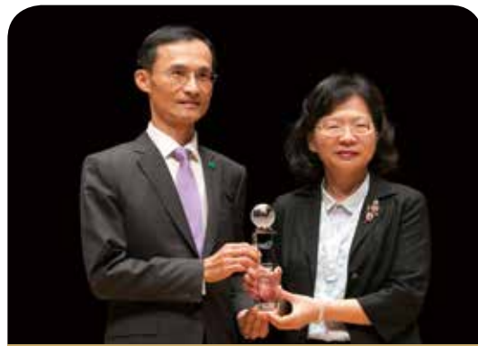
國泰人壽保險公司

富邦人壽始終以客戶角度主動設想優化服務，重視專業人才養成，透過提升傳承經驗、優化專業訓練、掌握金融科技發展脈動、強化複合型專業人才養成、導入客製服務、100%落實法遵，以全面提供保戶更專業的服務！未來將持續培育卓越素質的專業人才，以「契合客戶需求」的角度提升客戶價值，達到「傳遞正動力，運轉新世紀」的願景。