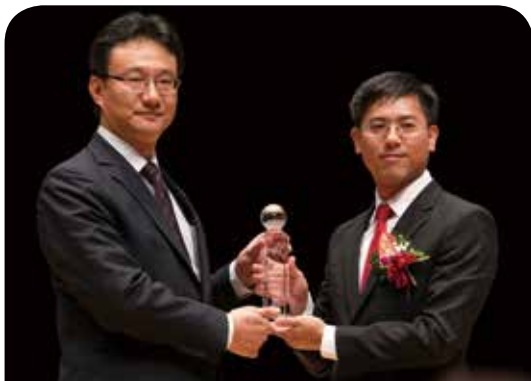
華南產物保險公司 網路購物贖品補償契約責任保險

華南產險秉持不斷創新之經營理念，持續掌握趨勢潮流研發新型態保險商品，滿足更多消費者保障需求。本商品之開發使得本公司成功跨足電商交易保障領域，亦為未來保險商品型態開啟重要的里程碑。華南產險本次能夠再度獲選最佳商品創意獎，更敦促我們繼續為保險創新價值而努力。