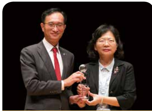
三商美邦人壽保險公司

國泰人壽始終秉持以人為本的理念，積極掌握趨勢、不斷創新，提供堅實培訓系統、多元學習資源與管道，讓老字號注入新思維，每位員工都能在大樹下成就自我。最佳保險專業獎的肯定，是榮耀，更是承擔，我們將持續善用培育力量，致力為組織、產業、社會孕育最優質人才，建立永續優質企業，肩負帶給社會安定力量與幸福感的使命！