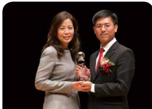
安達人壽保險公司 戰略贏家變額萬能壽險

台灣老化指數破百再創新高，有鑑於國人善終意識抬頭，富邦人壽推出國內首張殯葬實物給付核准制商品，打破傳統壽險框架，首度以「殯葬服務為給付內容」，提供業界唯一單獨禮儀服務等七大精選套裝方案；打造物超所值實物給付，設計補償金機制，以及跨界聯手的全新雙軌服務，落實高齡社會老有所終的精神。期許發揮更多商品創意，做到「商品責任化」，實踐企業社會責任！