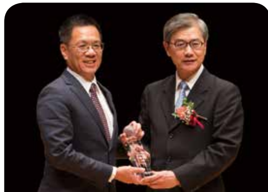
富邦人壽保險公司

新光人壽已獲頒第18座「最佳社會責任獎」，深耕台灣50餘年，公益關懷面向既深且廣；因應高齡社會發展創意老化專案、響應生態環保、關注社會安全、青年學子、全民健康及弱勢等。未來新光人壽將繼續堅持並具體實踐企業社會責任，發揮「光無所不在，心与你同在」的品牌精神，努力照亮社會每個角落，成為社會安定的力量。