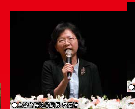
●金管會保險局局長 李滿治