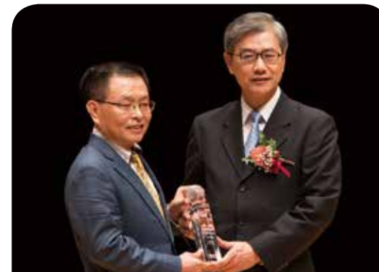
公勝保險經紀人公司

「信 不只是信守 是對弱勢機構持續付出的堅定承諾；望 不只是盼望 是期許受助者能自立，進而轉為助人者；愛 不只是回饋 而是在生活中徹底落實行善意念。」永達保經已屆滿17年，始終秉持保險專業、誠信、執著與善心持續回饋社會，發揮保險從業人員的責任與精神，以善盡企業社會責任，不僅延伸保險業互助的宗旨，更落實MDRT全人關懷的理念。