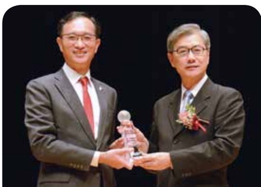
三商美邦人壽保險公司

富邦產險致力推動安全永續的社會環境，期望藉由優質的保險商品保障大眾人身與財產的安全，進而延伸至人與環境間的正向連結，實現保險的價值。富邦產險除持續研發創新且符合社會需求的商品外，也與國內外學術機構合作研發災害模型及損防技術，以提供客戶更加先進且完整的服務；同時每位同仁亦為愛心志工社成員，結合集團資源推廣助學及社福專案，為社會貢獻一己之力。