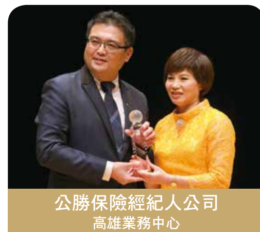
公勝保險經紀人公司 高雄業務中心

感謝公司的優質環境及提供的資源，讓專吉利能夠從全國46所大學院校教授的嚴格評審中獲此殊榮，感謝主辦單位對我們的肯定與鼓勵，這份榮耀是屬於專吉利全體伙伴的，我們秉持「責任共擔」「榮耀共享」「團隊共好」的精神，繼續「傳承」保險「信任」「希望」「關愛」的核心價值，培養專業人才在保險領域中實現自我價值。