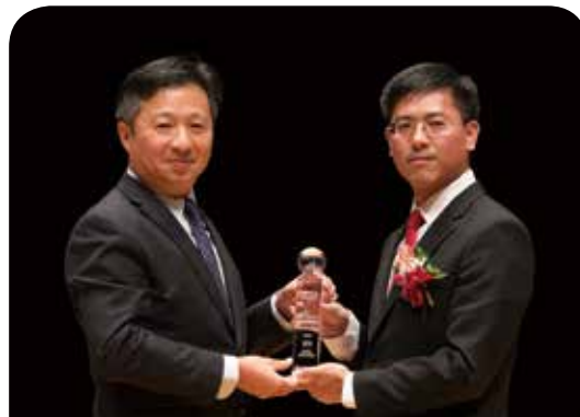
泰安產物保險公司 任意汽車保險車聯網UBI附加條款

「富邦產物環境污染責任保險」榮獲本屆保險信望愛最佳商品創意獎，特別感謝評審委員們的肯定，未來本公司仍持續秉持「誠信、親切、專業、創新」的服務理念，致力研發更多優質商品，提供企業完善優質的保障，期許相關保險商品可促進社會經濟穩定發展，並配合經濟全球化趨勢，推展全球性保障商品，協助其風險移轉、永續經營。