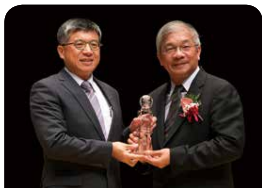
新光人壽保險公司 「HER大女子保險計劃」商品廣告

新光人壽因應女力的崛起，透過大數據分析，掌握「她經濟」潮流，針對女性消費族群所推出的『HER大女子保險計劃』，廣受市場好評，透過全方位的整合行銷廣告宣傳策略規劃，有效成功觸及到目標客群，未來新光人壽將持續關注社會發展與民眾需求，不間斷在商品、服務等方面創新，提供給大眾最安心、最優質的服務，共創美好人生。