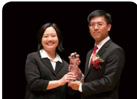
三商美邦人壽保險公司 愛關懷重大傷病帳戶型終身健康保險[ICI]

十分榮幸能夠獲得肯定。安達人壽始終秉持【卓越工匠 精湛工藝】的企業核心精神，堅信保險的功用不僅是提供保障，而應包含更多更廣的面向，長期觀察並分析當地及國際的金融市場動態、趨勢，發展創新多元的保險商品與服務，滿足客戶針對財富與風險管理的全方位需求，未來會持續以創新的理念提供完整的人身暨財務安全保障與風險管理規劃，讓客戶輕鬆享有安穩富達的未來。