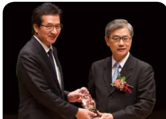
永達保險經紀人公司

「信 不只是信守 是對弱勢機構持續付出的堅定承諾；望 不只是盼望 是期許受助者能自立，進而轉為助人者；愛 不只是回饋 而是在生活中徹底落實行善意念。」永達保經已屆滿17年，始終秉持保險專業、誠信、執著與善心持續回饋社會，發揮保險從業人員的責任與精神，以善盡企業社會責任，不僅延伸保險業互助的宗旨，更落實MDRT全人關懷的理念。