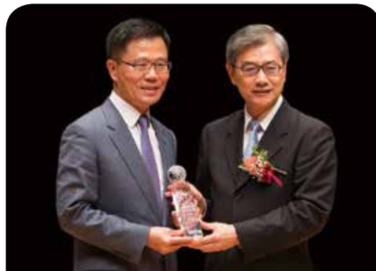
國泰人壽保險公司

富邦人壽在公益推動上持續強化「高齡關懷」的廣度與深度，從健康促進、社區支持、經濟守護三大面向執行「銀光樂活專案」，推動全員失智守護天使計劃、打造全台通訊處成為失智友善據點；推動全台「友善好鄰居專案」，結合跨業夥伴整合資源成為在地社區的支持力量；並首創緊急應變中心，扮演重要的統籌與資源調度功能。同時推動全民健康，帶領民眾邁向樂齡生活。