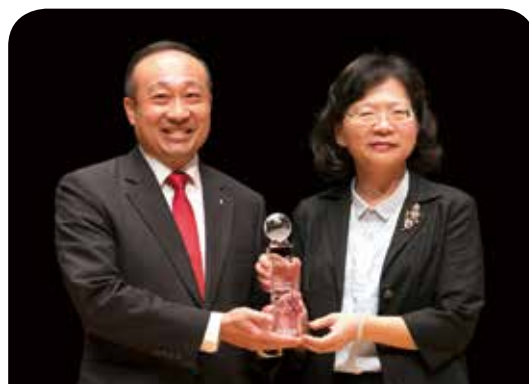
三商美邦人壽保險公司

新光人壽長期致力於保險教育推廣，培養新世代保險專業人才，目前已與國內30所大專院校簽訂產學合作。用心深耕保險教育、縮短學用落差，為保險業培育菁英有成，第九度獲得「最佳保險教育貢獻獎」肯定。今年更因應時代趨勢，首創「InsurTech暑期實習計畫」，以優渥日薪提供實習生進行金融實務及InsurTech專業課程訓練，未來能從容面對市場挑戰，順利接軌就業。