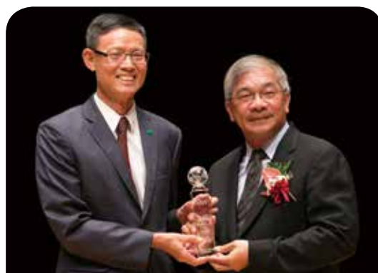
國泰世紀產物保險公司 業界首創全方位服務流程國泰產險旅綜險「數位服務一條龍」

富邦人壽預見高齡化社會衝擊，率先回應社會需求，呼應政府長照2.0政策，積極推動高齡、失智關懷，為有效推動此行動專案，以服務行動力、行銷推動力、跨業合作力、媒體傳播力為四大整合傳播行動，協助民眾，關懷高齡、預防失智並做好健康管理。整體專案透過線上/線下整合傳播，總計觸及逾17萬人次、關心到3.5萬名長者。