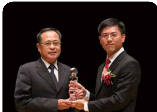
富邦產物保險公司 環境污染責任保險

華南產險秉持不斷創新之經營理念，持續掌握趨勢潮流研發新型態保險商品，滿足更多消費者保障需求。本商品之開發使得本公司成功跨足電商交易保障領域，亦為未來保險商品型態開啟重要的里程碑。華南產險本次能夠再度獲選最佳商品創意獎，更敦促我們繼續為保險創新價值而努力。