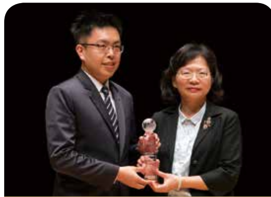
公勝保險經紀人公司

磐石保經破業界紀錄蟬聯最佳保險專業獎9連霸。磐石透過IFA第三方獨立理財顧問模式服務客戶，強調全面、客觀、創新及熱誠，以客戶需求為導向，提供專業諮詢。因應全球進入FinTech時代，結合即時數位分析系統平台提供客戶專屬服務，並強化資訊安全管理，今年初更獲得全球最具權威英國標準協會（BSI）ISO 27001「資訊安全管理系統國際標準」驗證。