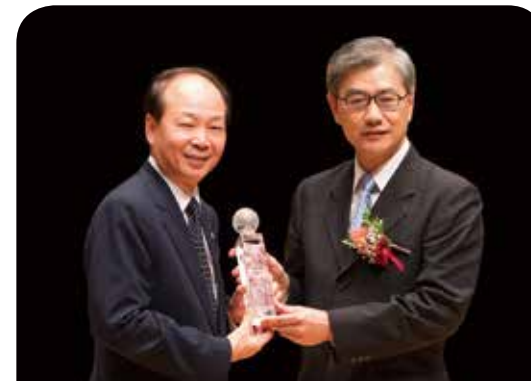
富邦產物保險公司

新光產險長期致力於公益關懷活動，105年以「新光送暖」為主題，推動各項專案如「寒士吃飽30」、「行動圖書車捐贈」等活動，更推出「雙倍新福，愛心計畫」投保結合公益捐贈，使保戶每次的投保更加有意義，因此再次獲得「最佳社會責任獎」的肯定，更加重我們的責任！未來仍將持續以公益回饋社會，達到「處處新光，讓愛發光」。