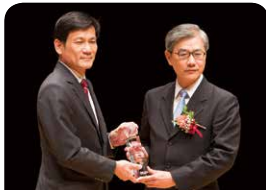
新光產物保險公司

新光產險長期致力於公益關懷活動，105年以「新光送暖」為主題，推動各項專案如「寒士吃飽30」、「行動圖書車捐贈」等活動，更推出「雙倍新福，愛心計畫」投保結合公益捐贈，使保戶每次的投保更加有意義，因此再次獲得「最佳社會責任獎」的肯定，更加重我們的責任！未來仍將持續以公益回饋社會，達到「處處新光，讓愛發光」。