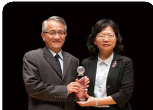
富邦產物保險公司

新光產險本著「勇於任事」的企業文化，穩健經營、專注踏實在本業相關的運作，由於重視人才培訓，獲得「台灣訓練品質系統(TTQS)」銅牌，及應屆畢業生調查的「最嚮往的產險公司」，更連續五年獲「最佳保險專業獎」、「保險品質獎」等獎項的肯定。未來將更以全方位的教育體系，提升人員專業，以提供客戶最優質的保險服務。