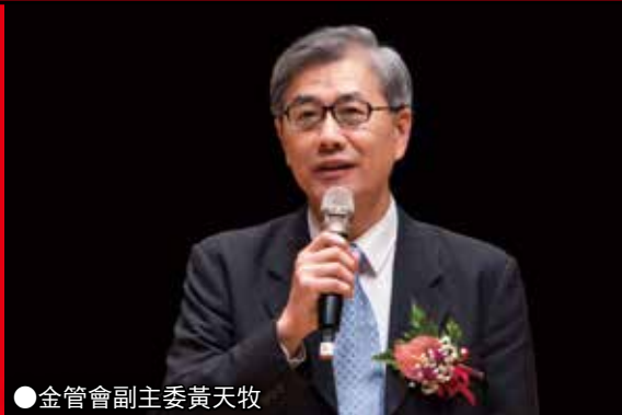
●金管會副主委黃天牧