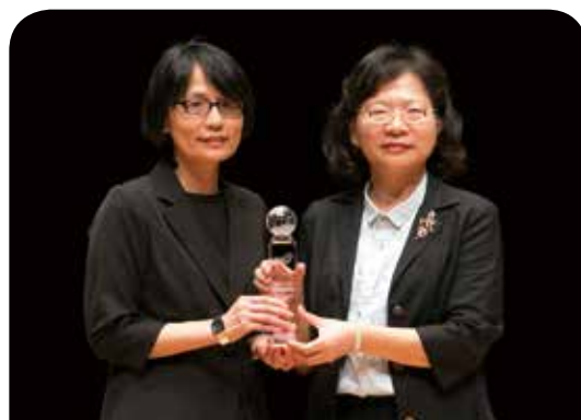
富邦人壽保險公司