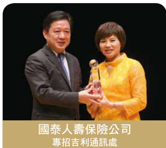
國泰人壽保險公司 專招吉利通訊處

感謝公司、各界長官、好友、單位夥伴及眾多客戶的支持與指導，更感謝主辦單位推動保險價值不遺餘力，正因「不以業績論英雄，只求保險真善美」這一句，激勵了我及團隊來角逐今年最佳通訊處獎項，進而得到此殊榮。這個獎更肯定了我個人信念「人生總分給付制」，並以「樂觀、包容、分享」的中心思想帶領富宅團隊，今後更能讓同仁及客戶們朝向均富且富足的人生邁進！