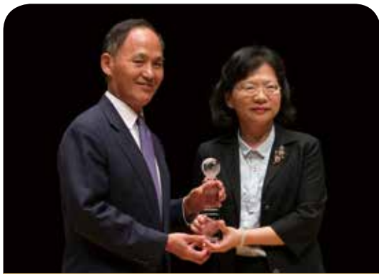
磐石保險經紀人公司