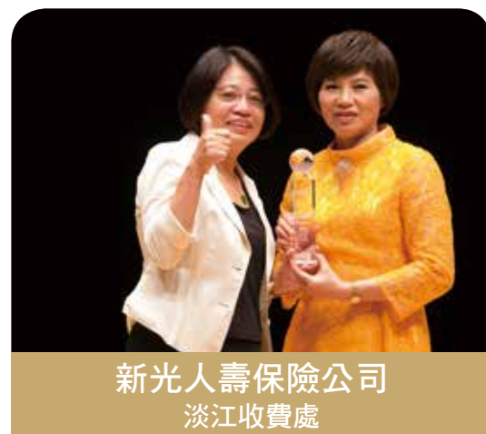
新光人壽保險公司 淡江收費處