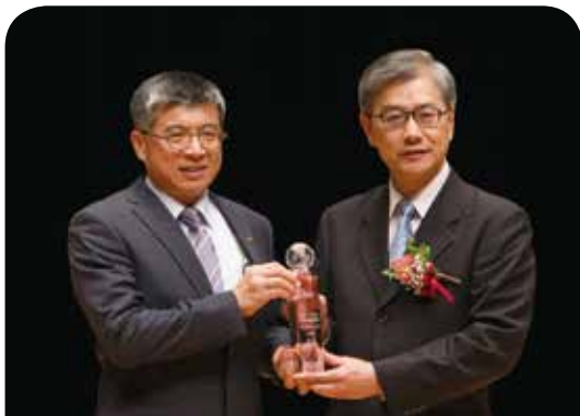
新光人壽保險公司

新光人壽已獲頒第18座「最佳社會責任獎」，深耕台灣50餘年，公益關懷面向既深且廣；因應高齡社會發展創意老化專案、響應生態環保、關注社會安全、青年學子、全民健康及弱勢等。未來新光人壽將繼續堅持並具體實踐企業社會責任，發揮「光無所不在，心与你同在」的品牌精神，努力照亮社會每個角落，成為社會安定的力量。