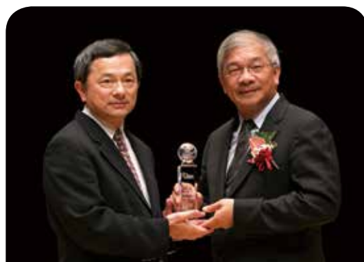
富邦人壽保險公司 富邦四力齊發 倡導銀光樂活人生

新光人壽因應女力的崛起，透過大數據分析，掌握「她經濟」潮流，針對女性消費族群所推出的『HER大女子保險計劃』，廣受市場好評，透過全方位的整合行銷廣告宣傳策略規劃，有效成功觸及到目標客群，未來新光人壽將持續關注社會發展與民眾需求，不間斷在商品、服務等方面創新，提供給大眾最安心、最優質的服務，共創美好人生。