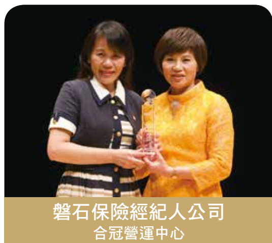
磐石保險經紀人公司 合冠營運中心