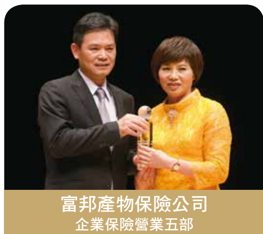
富邦產物保險公司 企業保險營業五部