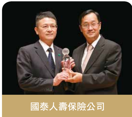
國泰人壽保險公司

富邦人壽具有完整三大通路布局，使民眾能夠便捷在全台8成銀行、168家代理業者等管道投保富邦人壽的保險商品，服務網絡堪稱業界第一。為弭平台灣城鄉的保險差距，積極推動「大無疆計畫」，並廣召青年回鄉創業服務，光2016年就新擴展了388個單位、遍及51個鄉鎮市據點，人力據點成長雙雙皆創業界之冠，成功將服務滲透全台各角落，逐漸成為民眾心目中的國民品牌。