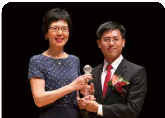
富邦人壽保險公司 長安寶(實物給付型)終身壽險

台灣老化指數破百再創新高，有鑑於國人善終意識抬頭，富邦人壽推出國內首張殯葬實物給付核准制商品，打破傳統壽險框架，首度以「殯葬服務為給付內容」，提供業界唯一單獨禮儀服務等七大精選套裝方案；打造物超所值實物給付，設計補償金機制，以及跨界聯手的全新雙軌服務，落實高齡社會老有所終的精神。期許發揮更多商品創意，做到「商品責任化」，實踐企業社會責任！