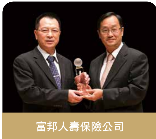
富邦人壽保險公司

連續5屆榮獲「最佳通路策略獎」，面對通路市場的激烈競爭，信守穩健踏實、創新的經營理念，搭配完繕通路策略，持續外部通路緊密合作，透過多元銷售管道(銀行保險、獨立保險經紀(代理)人、電話行銷、樂CALL保、職團開拓、機場櫃檯、OIU國際保險業務)，服務滿足不同客群需求，日後將以精益求精態度持續締造佳績，再享榮耀。