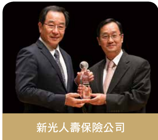
新光人壽保險公司

連續5屆榮獲「最佳通路策略獎」，面對通路市場的激烈競爭，信守穩健踏實、創新的經營理念，搭配完繕通路策略，持續外部通路緊密合作，透過多元銷售管道(銀行保險、獨立保險經紀(代理)人、電話行銷、樂CALL保、職團開拓、機場櫃檯、OIU國際保險業務)，服務滿足不同客群需求，日後將以精益求精態度持續締造佳績，再享榮耀。