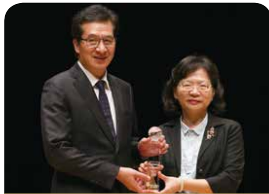
永達保險經紀人公司