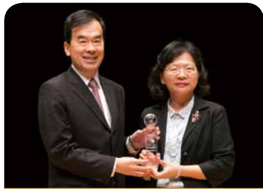
富邦人壽保險公司

富邦人壽始終以客戶角度主動設想優化服務，重視專業人才養成，透過提升傳承經驗、優化專業訓練、掌握金融科技發展脈動、強化複合型專業人才養成、導入客製服務、100%落實法遵，以全面提供保戶更專業的服務！未來將持續培育卓越素質的專業人才，以「契合客戶需求」的角度提升客戶價值，達到「傳遞正動力，運轉新世紀」的願景。