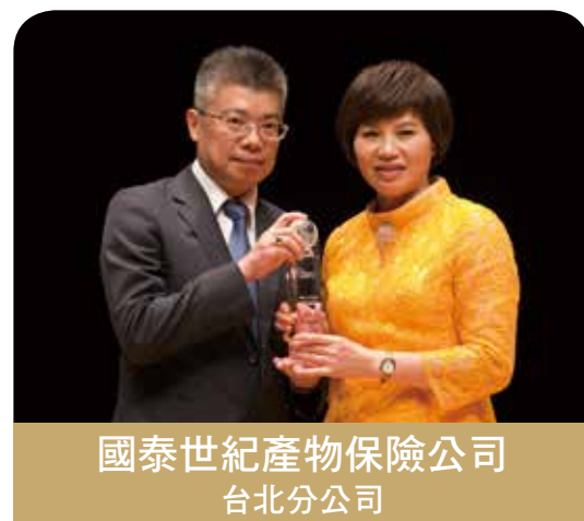
國泰世紀產物保險公司 台北分公司