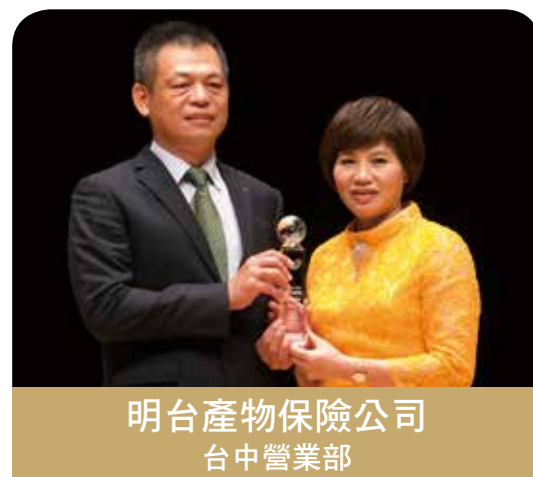
明台產物保險公司 台中營業部

非常榮幸獲得此殊榮，感謝評審對富邦產險企業保險營業五部的肯定。為滿足客戶的需求，營業五部同仁持續提升自我專業及推動新創商品，與客戶建立長遠的關係。