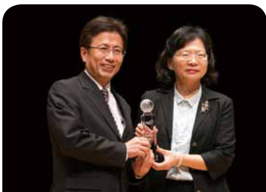
新光人壽保險公司