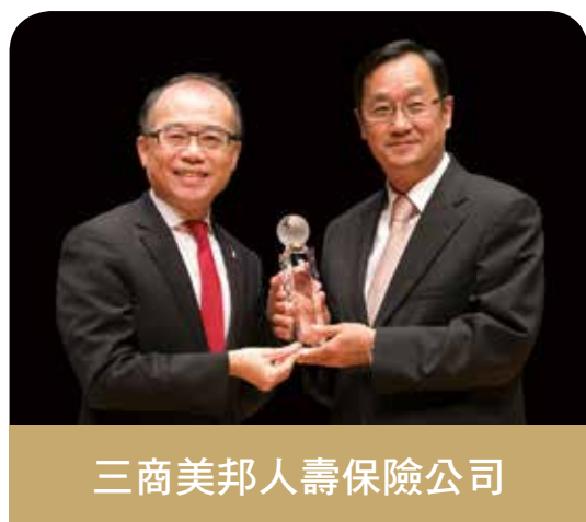
三商美邦人壽保險公司

國泰人壽秉持以客戶為中心的精神，透過五大通路共同合作，運用科學化管理工具，提供客戶全方位專業的服務，為客戶從出生、學生、壯年到終老，每個生涯階段提供最貼心的體驗。感謝評審對國泰人壽的肯定，讓國泰對客戶的用心被看見，我們將持續努力守護每個家庭，貫徹「給人幸福就是幸福」的理念。