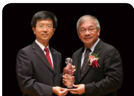
三商美邦人壽保險公司 【守護未來】公益形象廣告

為使消費者能帶著保障安心出國，國泰產險首創業界旅綜險「數位化一條龍」服務，只要在旅遊出發前一小時，透過bobe網站即時投保、選擇環保方便的電子保單，搭配下載全方位功能「國泰旅遊御守APP」，整張保單放在手機帶著走，更內建中英對照的旅遊不便應對步驟，語言不通也免驚，數位服務整合一次到位，提供消費者良好體驗。