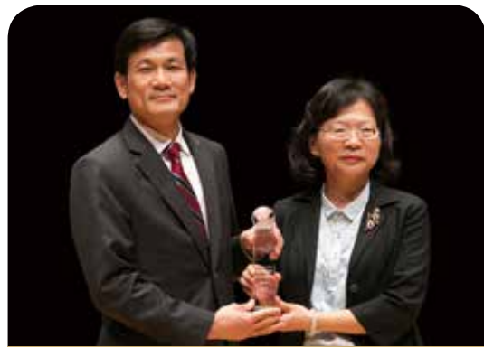
新光產物保險公司

新光產險本著「勇於任事」的企業文化，穩健經營、專注踏實在本業相關的運作，由於重視人才培訓，獲得「台灣訓練品質系統(TTQS)」銅牌，及應屆畢業生調查的「最嚮往的產險公司」，更連續五年獲「最佳保險專業獎」、「保險品質獎」等獎項的肯定。未來將更以全方位的教育體系，提升人員專業，以提供客戶最優質的保險服務。